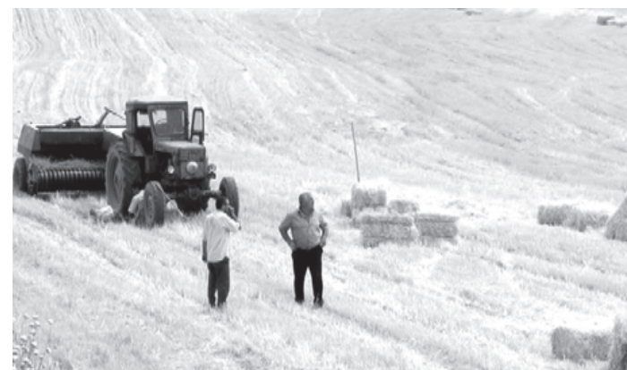
Самарикай тукер къазва