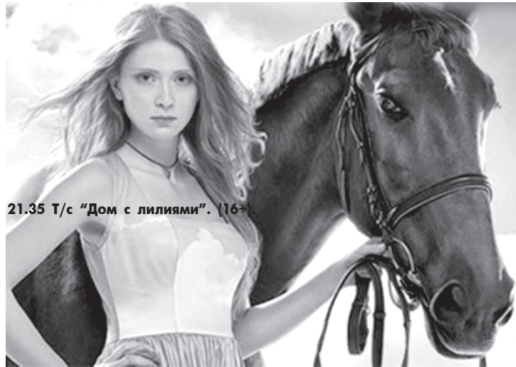
21.35 Т/с «Дом с лилиями». (16+)