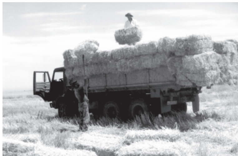
Тукер машиндиз язвавай вахт

Никера исятда булвилелди самун алаф ава. Алафдин суракъда - къайгъуда авайбурни чкадал алазва. Иллаки абур мал-къара къалин хъанвай Агъул, Хив рай-