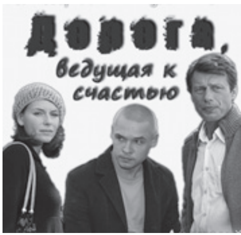
21.10 Х/ф "Идеальное убийство". (16+)

6.00 Т/с "Дорожный патруль". 8.00 "Сегодня". 8.15 "Русское лето Плюс"