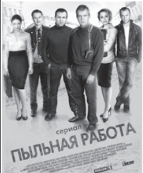
сериял ПЫЛЬНАЯ РАБОТА

7.00 "ТНТ.Мик". 7.35 М/с "Пингвины из Мадагаскара". 8.00 М/с "Пингвины из Мадагаскара"