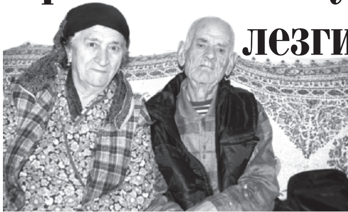
Магъмуд Сараби уьмуьрдин юлдаш Шахзадедихъ галаз