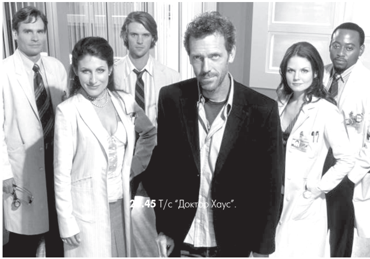
21.45 Т/с «Доктор Хаус».