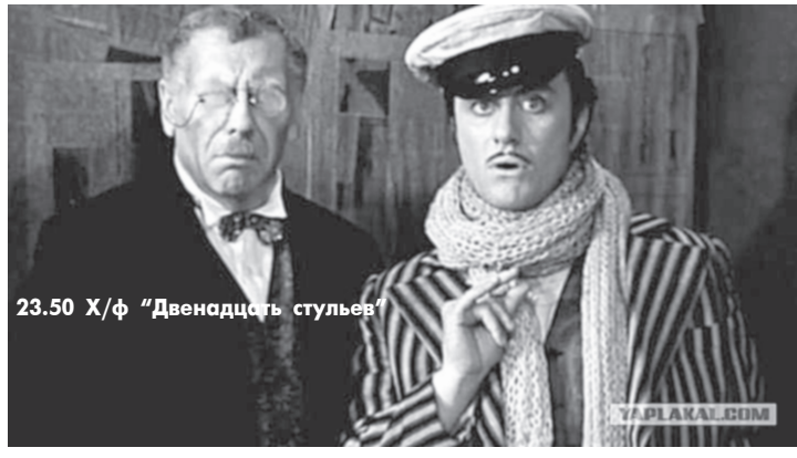
23.50 Х/ф «Двенадцать стульев»