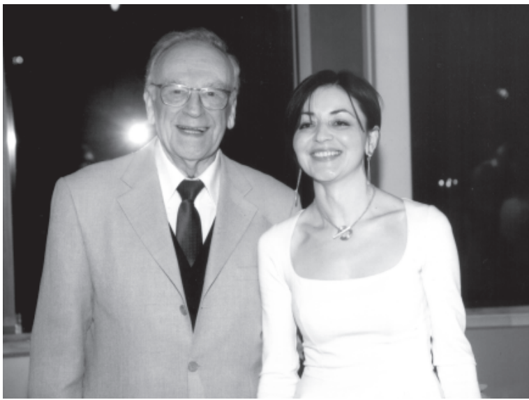
Светлана Игорь Кирилловахъ галаз

Италиядай хтайла, вичин пешедин рекъай устад хъанвай руша Пермь шегъерда Россиядинни Италиядин саналди тир "Италлогистика" ООО ачухна. Адан фирмади вири Россиядин региона, гъакъни Социда спортдин объекттар таракламышунин кардани иштиракна. 2013-йисан нетижайрай международный рейтингвий Союзди адан фирмадиз "Россиядин лидер - 2013" лагъай федеральный сертификат ва вичини "Баркаллу Гъед. Россиядин экономика" орден гана. 2014-йисан 23 декабрдиз адаз ФСРП-дин (карчи вал вилик тухуз куьмек гудай фонд) президентдин къарардалди "Карчи вал вилик тухунай" медаль гана. 2015-йисан 5-мартдиз ФСРП-ди "Еридин милли знак" медаль гана.