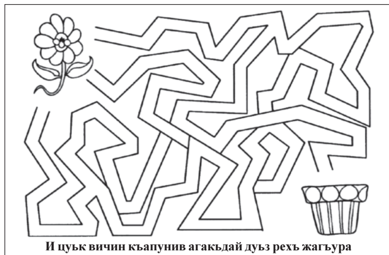
И цуьк вичин кьапунив агакьдай дуьз рехь жагьура