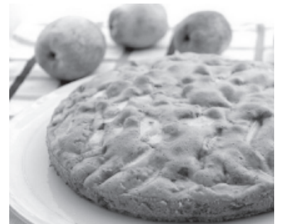
Гъазурайди - Ж.ГЪАСАНОВА.

Пичинин духовка ифирда ва чрадай чарчел (пекарская бумага) тини вегьена, 40-45 декьикада къван духовкада чрада.