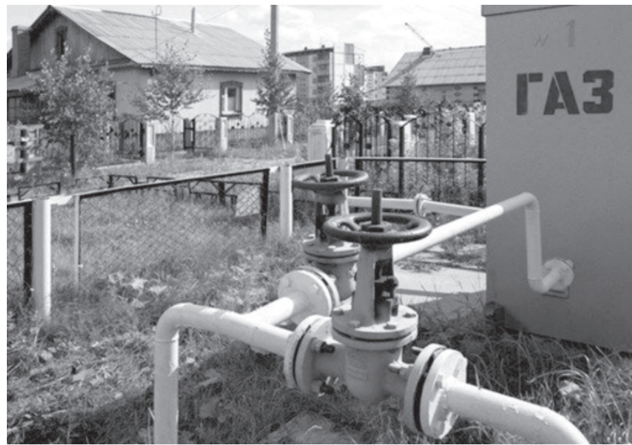
Къулайвал хъанватлани, къайгъуяр артух жезва

лугъчияр бес жезвач. Чи карханадин пешекарри гзаф вахтара МЧС-дин, "Ростехнадзор"-дин работникрихъ галаз санал квалахзава. Гъар са абонентди чкадин ЭГС-дихъ галаз алакьа хуьн чарасуз я. ЭГС-ди газдикай менфят къачузвай гъар са абонентдихъ галаз квалерин кьенепата ийизвай газдин къуллугъарин жигьетдай икьрар кутунзава. Дагьлух районра, шегьерра газ тухванвай вири квалер ахтармишиз агакьзавач. Идан себебни, винидихъ къейд авурвал, работникрин патэхъай кьитвал аваз хуьн я. Нетижда бязи агъалияр вахтуналди чи карханадин гуьзчивиликай хкатзава. Абонентди, ЭГС-дихъ галаз икьрар авачиз газдикай менфят къачузвайди чи карханадин пешекарриз малум хъанмазди, абуроз а кас газдикай магърумдай ихтияр ава. ЭГС-ди абонентдихъ галаз кутунзавай икьрар-