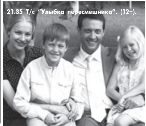
21.35 Т/с «Улыбка пересмешника». (12+).