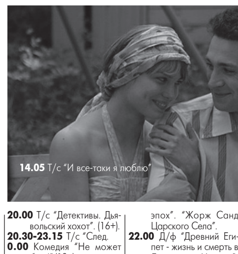
14.05 Т/с «И все-таки я люблю»

14.10 «Наша Москва». (12+). 14.30 «События». 14.50 «Город новостей». 15.10 «Хроники московского быта. Когда женщины на пьете». (12+). 16.00 Т/с «Чисто английское убийство». «Семейные разборки». 17.30 «События». 17.50 Т/с «Чисто английское убийство». «Семейные разборки».