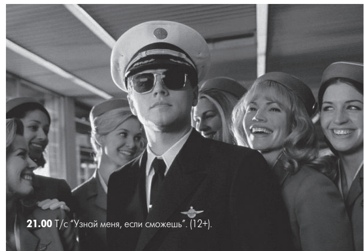
21.00 Т/с «Узнай меня, если сможешь» (12+).

6.00 М/ф. 9.00 Д/ф «Далеко и еще дальше с М. Кожуховым». 10.00 Параллельный мир.