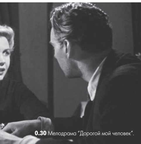
0.30 Мелодрама «Дорогой мой человек».

13.35 «Простые сложности». 14.10 «Наша Москва». (12+). 14.30 «События». 14.50 «Город новостей». 15.10 Д/ф «Короли без каплуны». (12+). 16.00 Т/с «Чисто английское убийство». «Вендетта по-английски». (12+). 17.30 «События». 17.50 Т/с «Чисто английское убийство». «Вендетта по-английски».