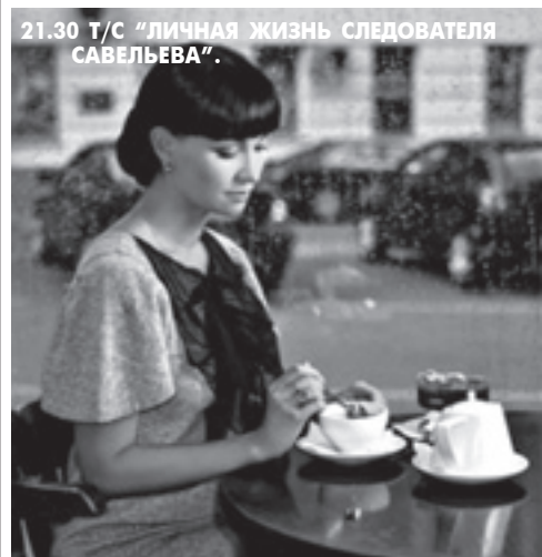
21.30 Т/с «Личная жизнь следователя Савельева»

6.30 Удачное утро. 7.00 Джейми: обед за 30 минут. 7.30 Джейми: обед за 30 минут. 8.00 Полезное утро. 8.40 М/ф. 9.40 Летний фреш. 10.10 Киноповесть «Семь часов до гибели» 11.30 По делам несовершеннолетних. 12.30 Спасите нашу семью. 14.10 Т/с «Метод Лавровой»