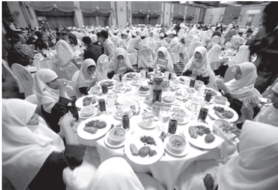
Сив хкудунин вахт

Рамазандин варз инанмиш мусурманрин арада жумартлувилинди ва регъимлувилинди яз гъисабзава. Ибн Аббаса лагъана: “Аллагъдин Пайгъамбар ﷺ виридалайни жумартлу кас тир ва мадни еке жумартлувал ада Рамазандин вацра ийидай. Хъсанвал авунин патахъай ам азад гаралайни жумартлу тир” . Аль-Бухари 6, Муслим 2308.