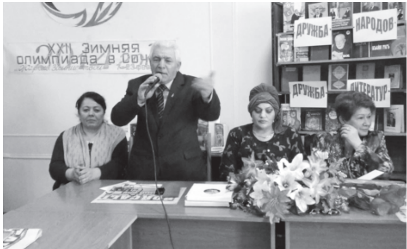
Дербентдин библиотекадин залда