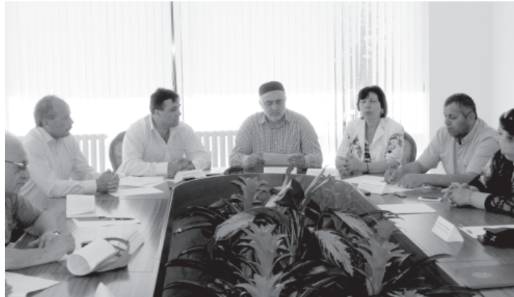
Хайи члаларин гележег веревирдзава