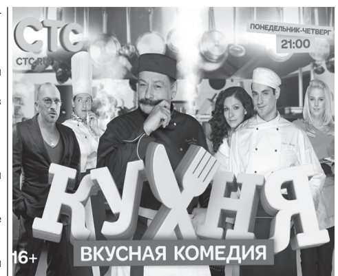
КУХНЯ ВКУСНАЯ КОМЕДИЯ

5.00 «ВОВОЧКА». Комедийный сериал. 6.00 Звонкий ужин. 7.00 «Информационная программа 112». 7.30 Информационное шоу «Свободное время». 8.30 Новости «24». 9.00 «Документальный спецпроект»: «Игры богов». 10.00 «Документальный спецпроект»: «Подземные марсиане». 11.00 «Реальная кухня». 12.00 «Информационная программа 112». 12.30 Новости «24». 13.00 Звонкий ужин. 14.00 «Мои прекрасные...» 15.00 «Семейные драмы». 16.00 Не ври мне! 17.00 Не ври мне! 18.00 «ВЕРНОЕ СРЕДСТВО». 19.00 «Информационная программа 112». 19.30 Новости «24». 20.00 Премьера. Информационное шоу «Свободное время». 21.00 Премьера. «Реальная кухня». 22.00 «Мои прекрасные...»