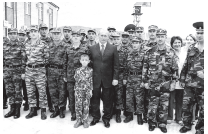
В.В.Путин Дербентдин погранотряддин “Чепелар” погранзавадал. 2005-й.

Россиядин Федерациядин сергъятдин яргъивал 60 агъзур километрдила алатзава. Ам гуьулерихъ, океанрихъ, вацарихъ дагъларихъ, тамарихъ галаз, алакьалу я. Чи уьлкве дуьньядин 16 госуударстводихъ галаз, гъа гъисабдай яз Америкадин Сад хъанвай штатрихъ