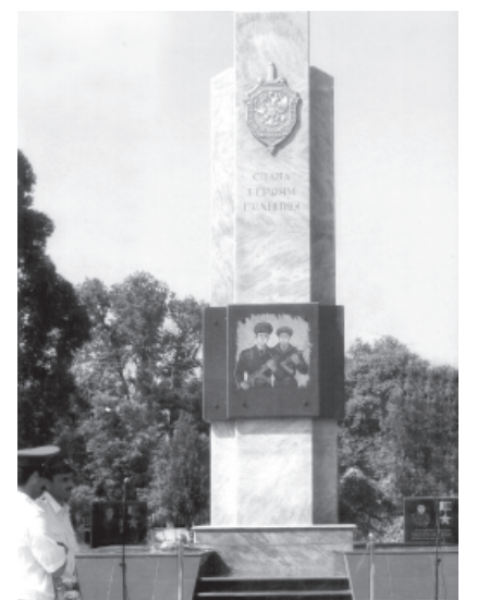
Каспийскда сергъятчийриз эцигнавай памятник

Малум тирвал, Советрин Союз госуударстводихъ (Азербайжан, Гуржистан, Иран, Туркменистан, Къазахстан) галаз сергъятламиш хъанва. Дагъустандин мулкунал алай Россиядин сергъятди 1180 километр тешкилзава. Луьгун лазим я хъи, алай вахт са акъван регъятди туш. Ара-ара къизгъинвилерни арадал къевезва. Чпин везифаяр на-