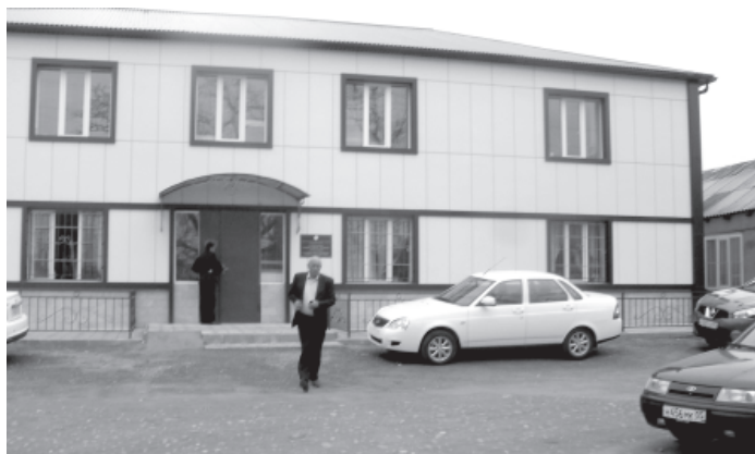
УСЗН-дин ц'ийн дарамат