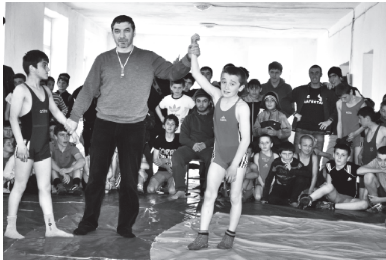
Турнир киле физвай вахт

Спортшколадин тербиячийри республикадин, Вирироссиядин турниррани акъажунра къвенкIвечи чкаяр къазва, пуд касдикай алай йисан сифте килера Къазахстан