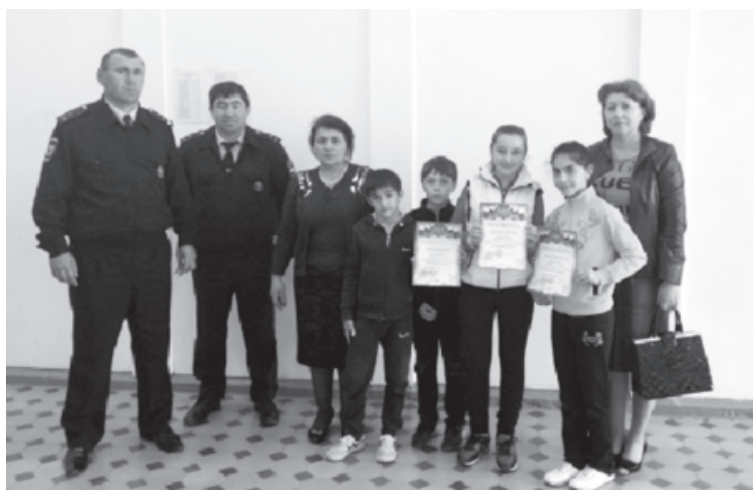
Гъалибвал къазанмишай команда

Къейд авун лазим я хъи, конкурсдин макъсад аялри рекъин гъерекатдин къайдайрал амал авун, сагълам уьмуьр пропаганда авун,