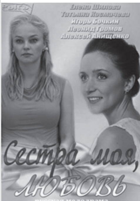
Сестра моя, любовь

6.00 «Настроение». 8.00 «События-Махачкала». 8.35 Х/ф «Одиноким предоставляется общежитие» 10.20 Д/ф «Любовь Соколова. Без грима». 11.10 «Петровка, 38». 11.30 «События». 11.50 Х/ф «Шутка». 13.40 «Без обмана». «Напикти с пазурьками». 14.30 «События».