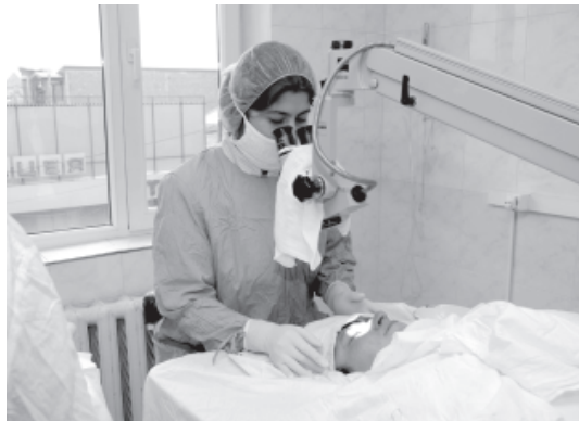
Республикадин афтальмологиядин больницадин духтур Г.К.Тагъироведи азарлудан вилер ахтармишзава