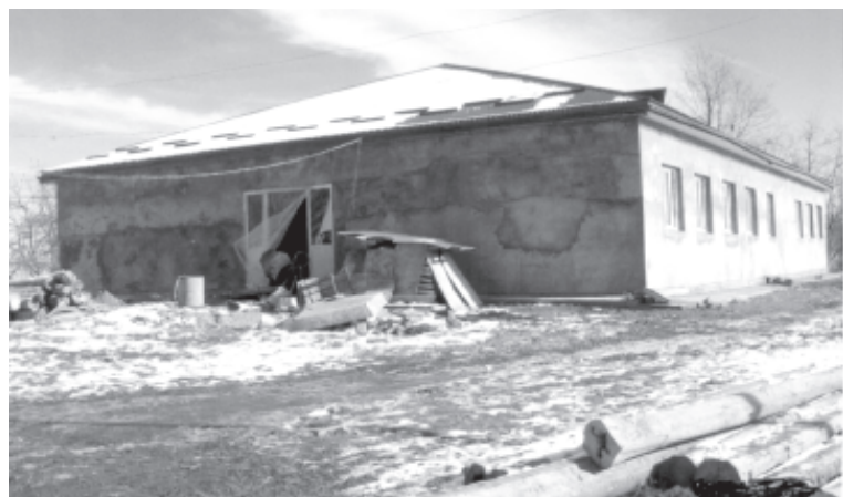
Гьеле эцигна куьтягь тавунвай Цналрин юкьван школадин дарамат