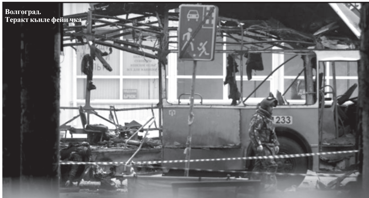
Волгоград. Теракт кыле фейи чка

Ибн Умара, кьуй адалай Аллагь рази хьурай, агакьарайвал: Садр Пайгьамбардивай ﷺ хабар кьуна: "Виридалайни хъсан инсанар гьибур я?" Ада жаваб гана: "Нихъ ялавлу рикл ва гьахълу мез аватла, гьабур". Адаз суал гана: "Чаз гьахълу мез вуч ятла чиди, амма ялавлу рикл вуч лагъай члал я?" Аллагьдин Пайгьамбарди ﷺ жаваб гана: "Им Аллагьдихъай киче, миьхи рикл я. Вичиз гунагъ, чалкечирвал, ажугъ ва пехилвал хас тушир рикл".