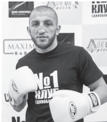
Жабар АСКЕРОВ - кикбоксингдай, какахъай жуьредин кукIунрай Европадаин ва дуьньядин чемпион, Киевдин рингдал 83-гьалибвал къазанмишна.