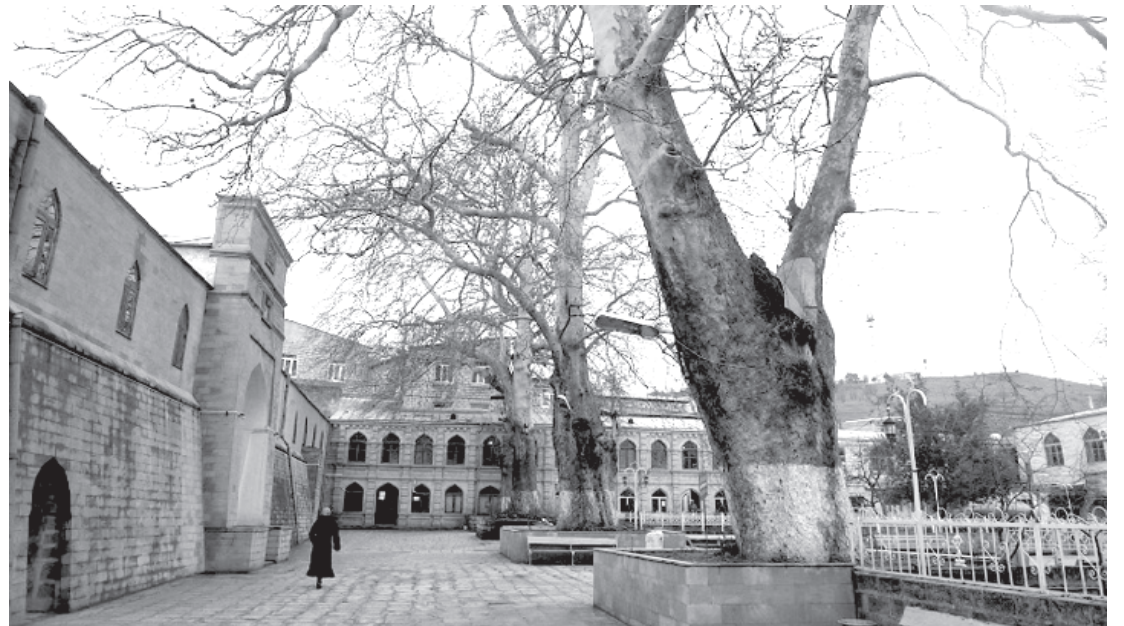
Дербентдин Жумья мискин

Пехилвилер, пехил ксар вири девирра ава къван. Икл, Азербайжандин шаир, Шемахида яшамеш хъайи къумукъ Сеид Азим Ширваниди лезги стхайрин яратмишунар “са клунчл чичекрив” (вични порея сортунив) гекигнай