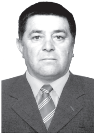
ВИ 60 ЙИСАН ЮБИЛЕЙ ТЕБРИКЗАВАЙ ХИЗАНАР, ЯРАР-ДУСТАР, МУКЪВА-КЪИЛИЯР.