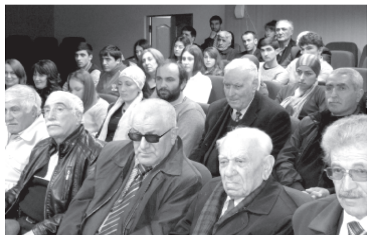
Мярекат итижлуди хъана

Абуру кьейд авурвал, къенин мярекат ФЛНКА-дин Жегилирин департаментди Махачкъалада кыле тухузвай сад лагьай серенжем я. Фикирдик инлай кьулухъ лезгийрин машгьур векилрин юби-