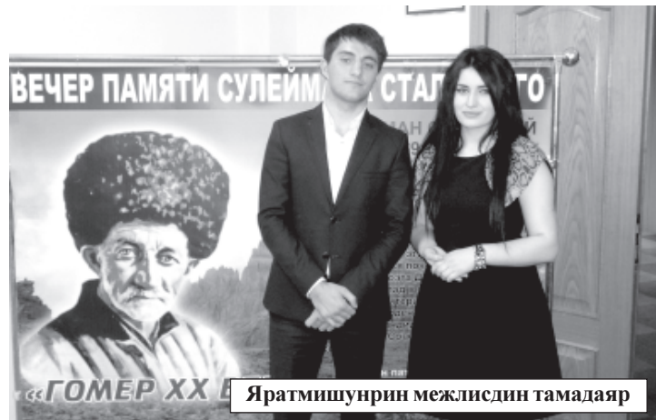
Яратмишунрин межлисдин тамадаяр

Яратмишунрин межлисдин эхирдай Жегилирин департаментдин векилри мярекатда иштиракчибуруз сагърай лагьана ва рикIел аламукьдай шикилар яна.