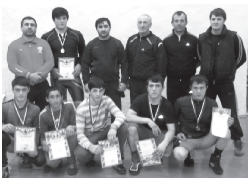
Турнирда 1-чкайриз лайихлу хъайи пагъливанар чпин тренерихъ галаз

И мукъвара Ахцегьрин 1-нумрадин СОШ-дин спортзалда райцентрадал алай 2-нумрадин ва Докъузпара райондин Цийи Къаракуьре хуьруьн ДЮСШ-рин тербиячийрин арада азаддаказ кьуршахар кьунай дуствилин турнир кыле фена. Ам ватан хуьдайбурун йикъаз талукъарнавай. Адан