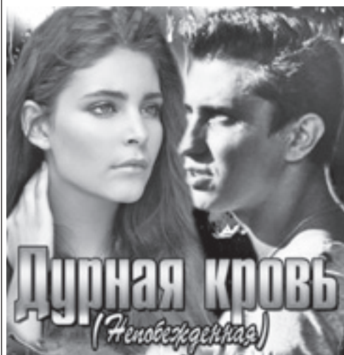
Дурная кровь (Женевская)