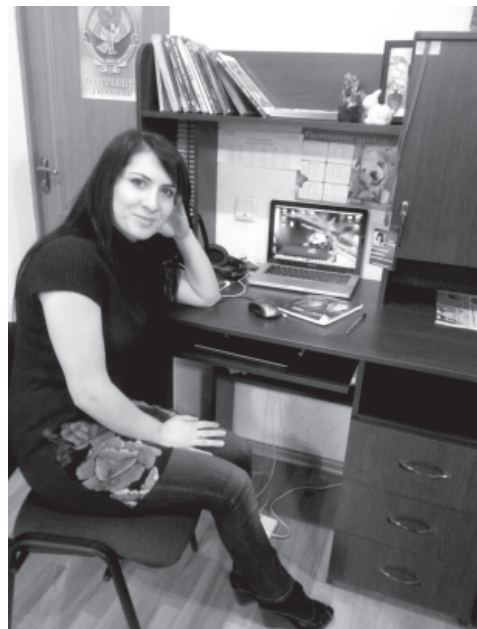
Урус члалан муаллим И.Шихвеледова тарс тухуз гъазур хъанва

Келзавай гъар са аялдин гьал-агъвал чна къилди-къилди ахтармишзава. Бязи аялар чпин яшариз килигна члехи классра тайинарнав, абурун чирвилер зайиф яз хъайитла, абурухъ галаз сифтегъан школадин программадай, къилдин план тукъуьрна, къвалах тухузва. Ина гъакни технический отделни кардик ква. Ана къвалахзавай пешекарри муаллимриз гъавурда авачир месэляяр ачухарзава, техникадин рекъай чирвилер артухариз ва компьютерри акъваз тавуна къвалах авуниз куьмек гузва.